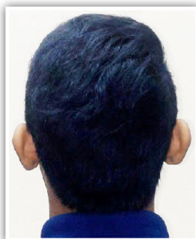
(ii). Tidak melepasi kolar